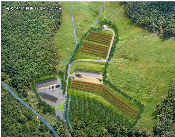
<(광양) 신품종 재배단지 조감도(조성중)>