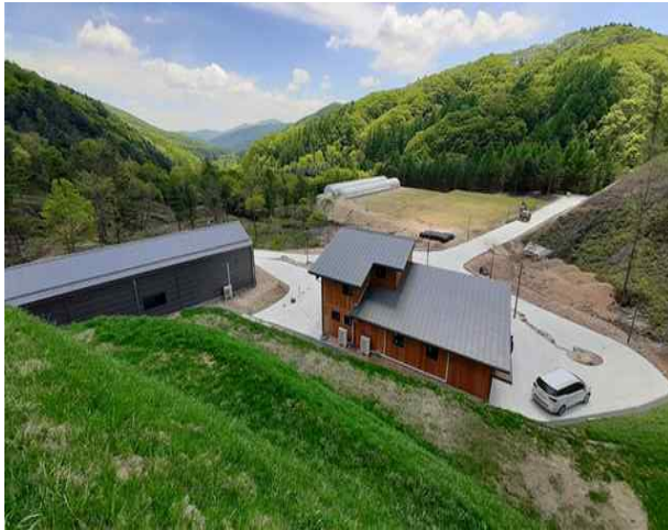
<(평창) 신품종 재배단지 전경>