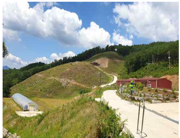
<(하동) 신품종 재배단지 전경>