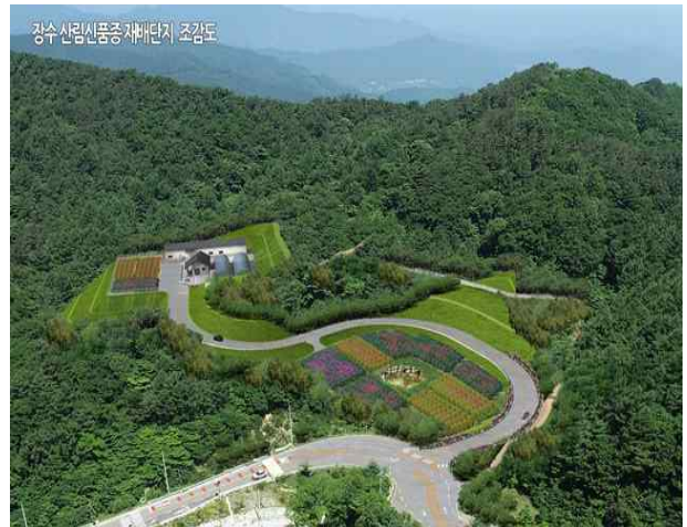
<(장수) 신품종 재배단지 조감도(조성중)>